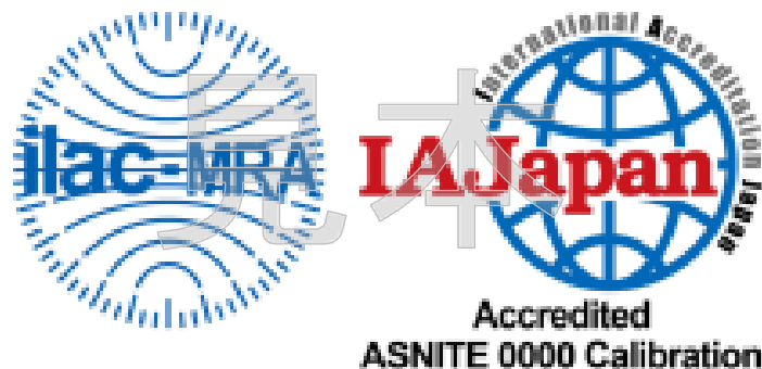
図1 認定事業者が使用できる認定シンボル

認定事業者は、認定された範囲について、図1のILAC MRA組み合わせ認定シンボルの使用及び認定要求事項に適合している旨の記載ができる。認定シンボルを使用する場合は、別に定める「IAJapan認定シンボルの使用及び認定の主張等に関する方針(URP15)」に掲げる事項を遵守すること。